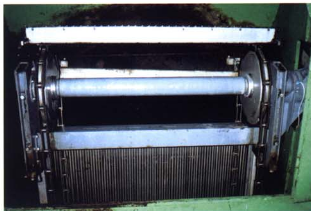
Řetězové česle v elektrárně