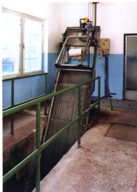
Vozíkové česle na ČOV