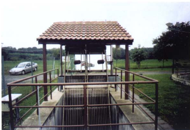
Vozíkové česle na ČOV