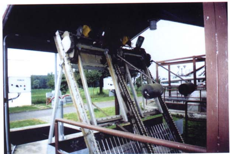
Detail dvou kusů vozíkových česlí