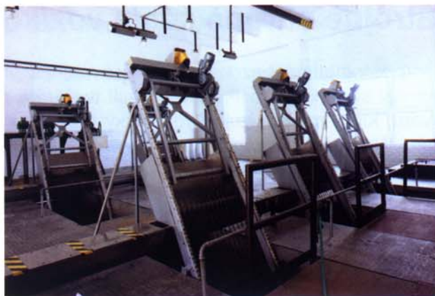
Vozíkové česle na ČOV

Čerpací stanice závlahových systémů využívají pro ochranu čerpadel na vtoku strojní česle. Vozíkové a řetězové strojní česle firmy INKOS se takto uplatňují například na závlahových systémech v Egyptě.